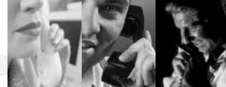
In einer repräsentativen Umfrage hat der FVLR 200 Personen telefonisch zum Thema Brandschutz interviewen lassen.

Nur drei Minuten bleiben im Brandfall, um ein Gebäude ungehindert zu verlassen. Dies war jedoch nur sehr wenigen der Befragten bekannt. 62 Prozent nahmen an, sie hätten über vier Minuten Zeit. Ein Drittel glaubte, es stünden mehr als sechs Minuten zur Verfügung. Jeder achte meinte sogar, es wären mehr als zehn Minuten – Einschätzungen, die fatale Folgen haben können.